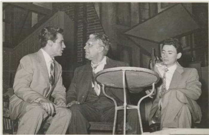
Imagen del primer estreno en España de 'La muerte de un viajante', en 1952, en el Teatro de la Comedia de Madrid, bajo la dirección de José Tamayo, y con Carlos Lemos y Francisco Rabal como protagonistas.